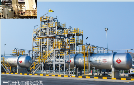
ブルネイの天然ガス由来水素プロジェクト