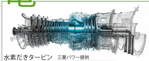
水素だきタービン