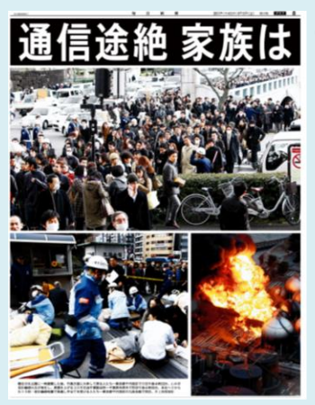
⑥ 同 東京本社 統合12版グラフ面