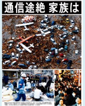
⑦ 同 東京本社 統合14●版グラフ面